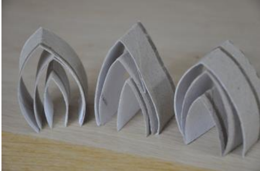
Foto 4: Verf de binnenste rood, de middelste oranje en de buitenste geel.

Foto 3: Nu schuiven de drie in elkaar tot een vlam.