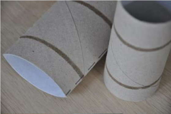
Foto 2: knip de reep in drie gelijke stukken van ruim 3 cm breed. Maak de stukken ongelijk van hoogte door van eentje 1 cm en van een ander 2 cm af te knippen.

Foto 1: maak de closetrollen plat. Knip een gevouwen kant open door precies de vouw eraf te knippen.